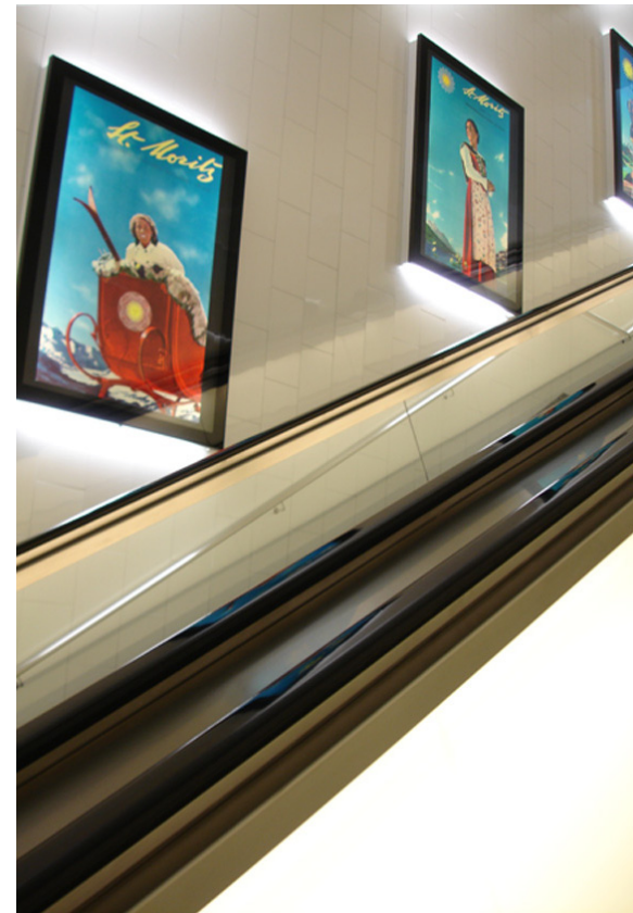
Bild Vorderseite Vorzone Parkhaus