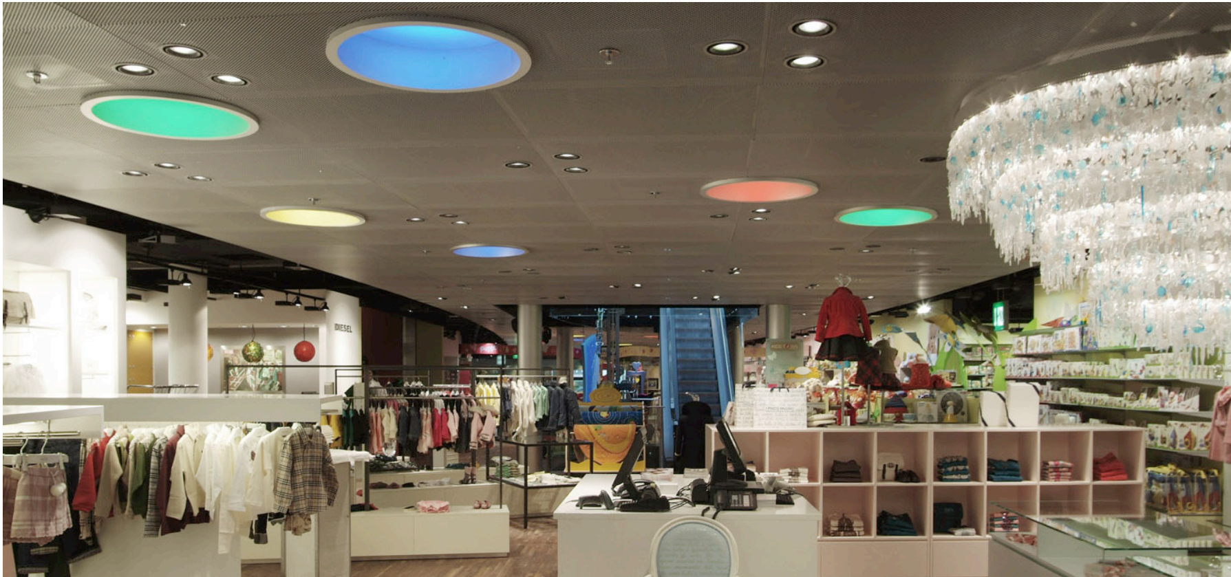
Bild Vorderseite Verkaufsraum 1. Obergeschoss