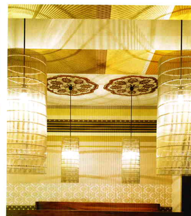
Trattoria „Da Loretta“, Stuttgart

Peter Ippolito: Der grenzenlose Optimismus, aber auch die Eindeutigkeit der Utopien der Moderne sind einer vermeintlichen Grenzenlosigkeit an Möglichkeiten und Heilsversprechen gewichen. Der explodierenden Anzahl an globalisierten Bildern, Lebensentwürfen, Ansichten, Wahrheiten steht ein wachsendes Verlangen nach Nähe, Geborgenheit, Weichheit und damit auch Sicherheit gegenüber. Die Sehnsucht nach Authentizität, haptischem Erleben, gefühlter und sichtbarer Materialität entspricht dem Wiederentdecken von Werten, die in einer Situation, in der alles möglich zu sein scheint, versprechen, Halt zu geben. Architektur, immer zugleich Spiegel und Protagonist von Gesellschaft und Kultur, reagiert darauf mit entsprechenden Materialien, Bildern und dem dazugehörigen Licht.