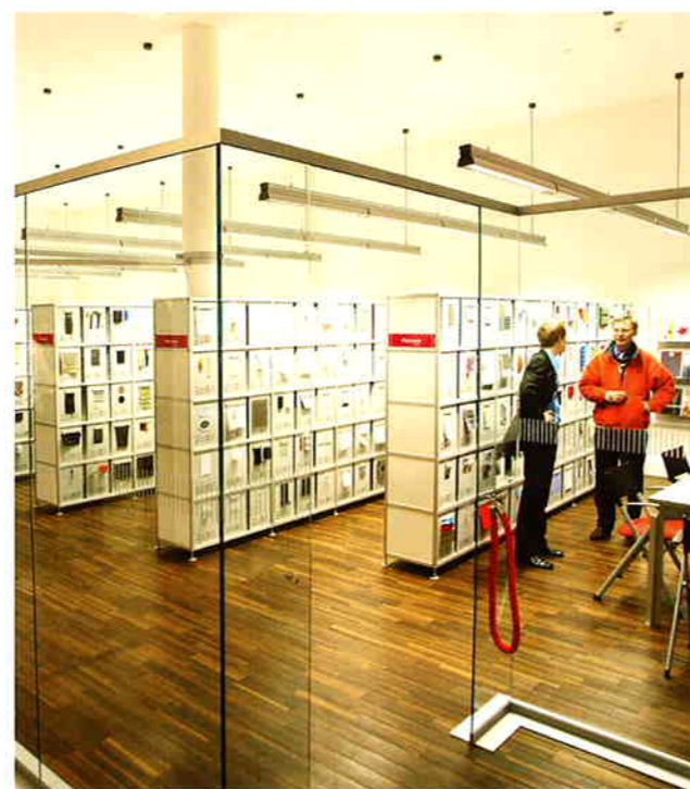
Showroom von Material ConneXion Cologne, Köln

Martin Beeh: Die Kühle der Klassischen Moderne war zum einen ein Zeichen der Abgrenzung von aller Gemütlichkeit und Emotionalität, sie musste radikal sein, um ihre Botschaft des Aufbruchs vermitteln zu können. Zum anderen, und das kam der Moderne ganz gelegen, waren die technischen Möglichkeiten zur Beleuchtungssteuerung noch sehr eingeschränkt. Die helle Fabrikbeleuchtung hatte keine Konkurrenz – außer dem Tageslicht eben. Zur heutigen Zeit, wo die meisten von uns der Natur – und damit den subtilen Schwankungen des Tageslichts, auch nach Jahreszeiten und Regionen unterschiedlich – als Fremdlinge gegenüberstehen, möchten wir etwas von der verloren gegangenen „Natürlichkeit und Subtilität“ zurückgewinnen. Heute müssen wir kein Meer von Kerzen entzünden, um ein behaglich-intimes Ambiente zu Hause oder in Restaurants zu schaffen. Die perfektionierte Lichtsteuerung kann die Räume je nach Lust und Laune in die unterschiedlichsten Lichtstimmungen bringen. Emotionale, amorphe Formgebung passt am besten in dieses Umfeld. Neue Materialien und Verarbeitungsmöglichkeiten eröffnen uns ungeahnte Möglichkeiten.